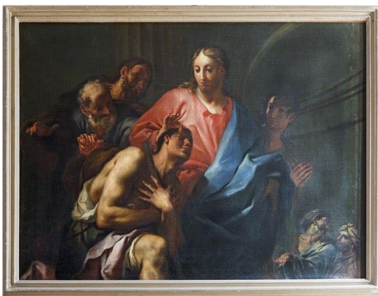
La guarigione del cieco nato – Chiesa di San Francesco della Vigna (Venezia)

In ottemperanza al Decreto della Presidenza del Consiglio dei Ministri del 8 marzo 2020 e in accordo con le disposizioni del Patriarca – in comunione con i Vescovi del Nordest – del 8 marzo 2020, non potendo celebrare pubblicamente, i fedeli sono invitati ad assolvere il precetto festivo, dedicando un tempo conveniente alla preghiera e alla meditazione, eventualmente anche servendosi del seguente schema.